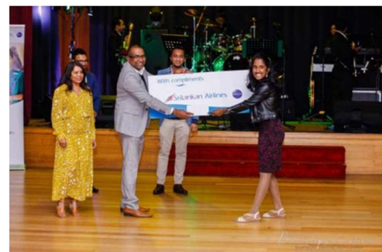
Hantane Nite 2022 in Pictures