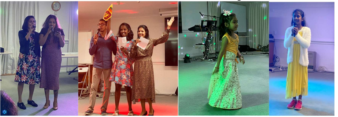
Evening entertainment and talent show in pictures